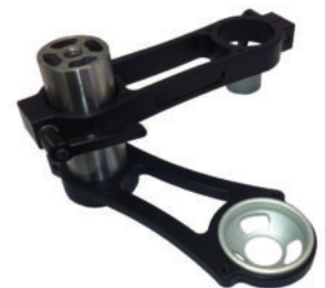
Hoch / Tiefausleger