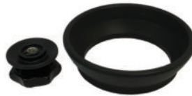
Adapter 100 auf 150mm