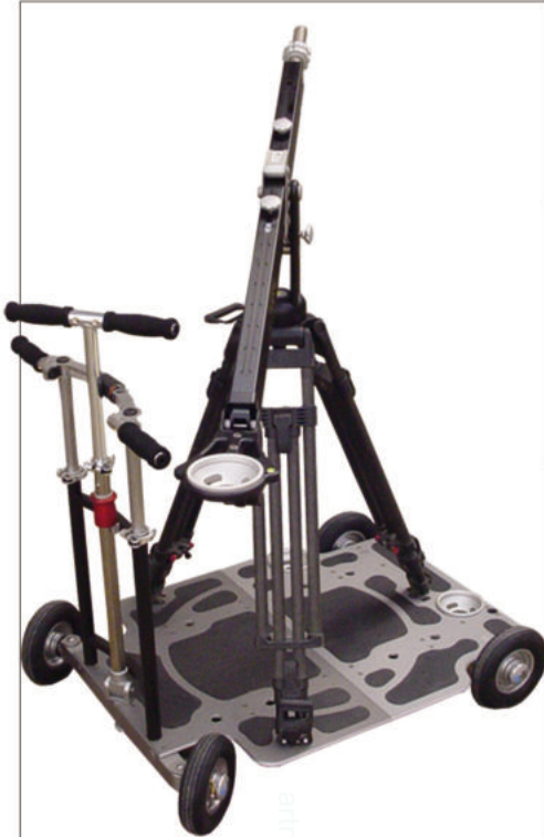
EJib auf LapTop Dolly