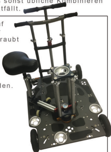
Dubble Sitzschwenk Option

Die Bazooka wird unten auf dem Standard Euroadapter des Drehkreuzes aufgeschraubt und hat oben eine 100mm Kugelschalenaufnahme. Mittels eines optionalen 100 auf 150mm Adapters können auch 150mm Fluidköpfe eingesetzt werden.